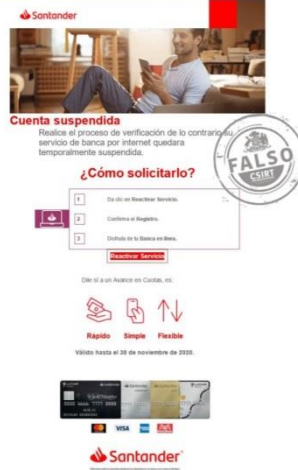
Imagen del mensaje