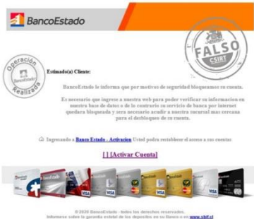
Imagen del mensaje