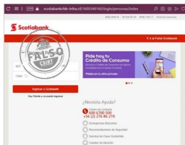
Imagen del sitio