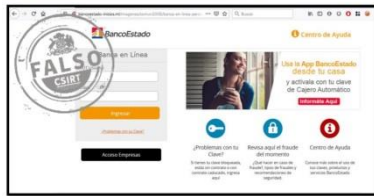
Imagen del sitio