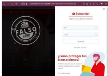
Imagen del sitio