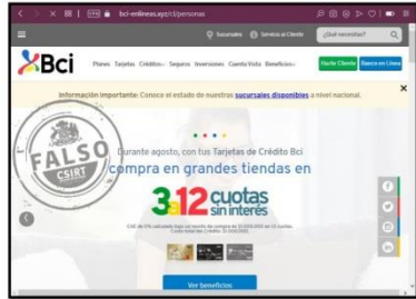
Imagen del sitio