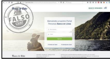
Imagen del sitio