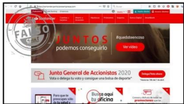
Imagen del sitio