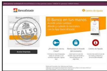
Imagen del sitio