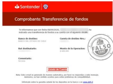
Imagen del mensaje