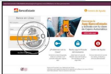
Imagen del sitio