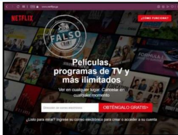
Imagen del sitio