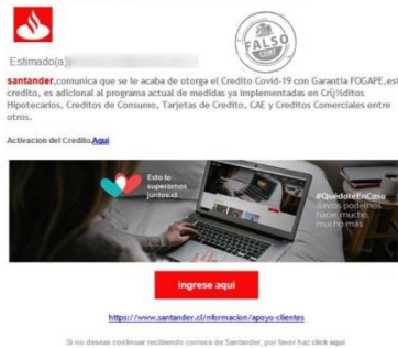
Imagen del mensaje