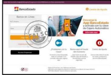
Imagen del sitio