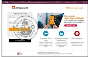
Imagen del sitio