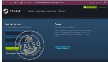
Imagen del sitio