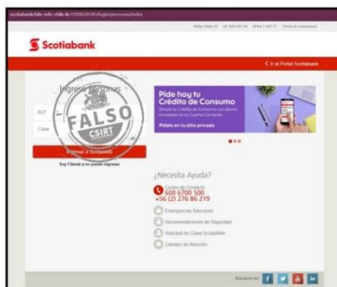
Imagen del sitio