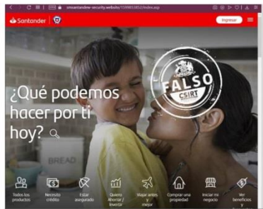
Imagen del sitio