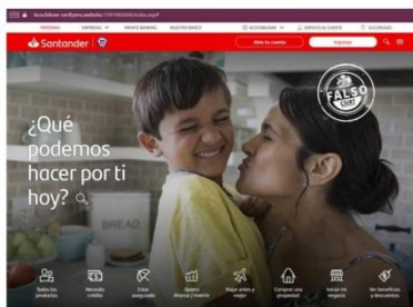
Imagen del sitio