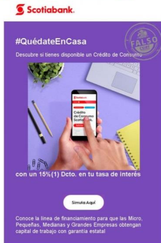
Imagen del mensaje