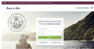
Imagen del sitio