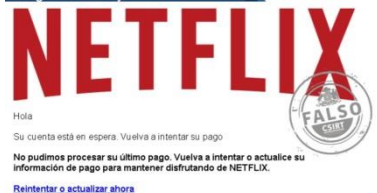
Imagen del mensaje