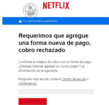
Imagen del mensaje