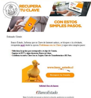
Imagen del mensaje