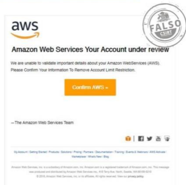
Imagen del mensaje