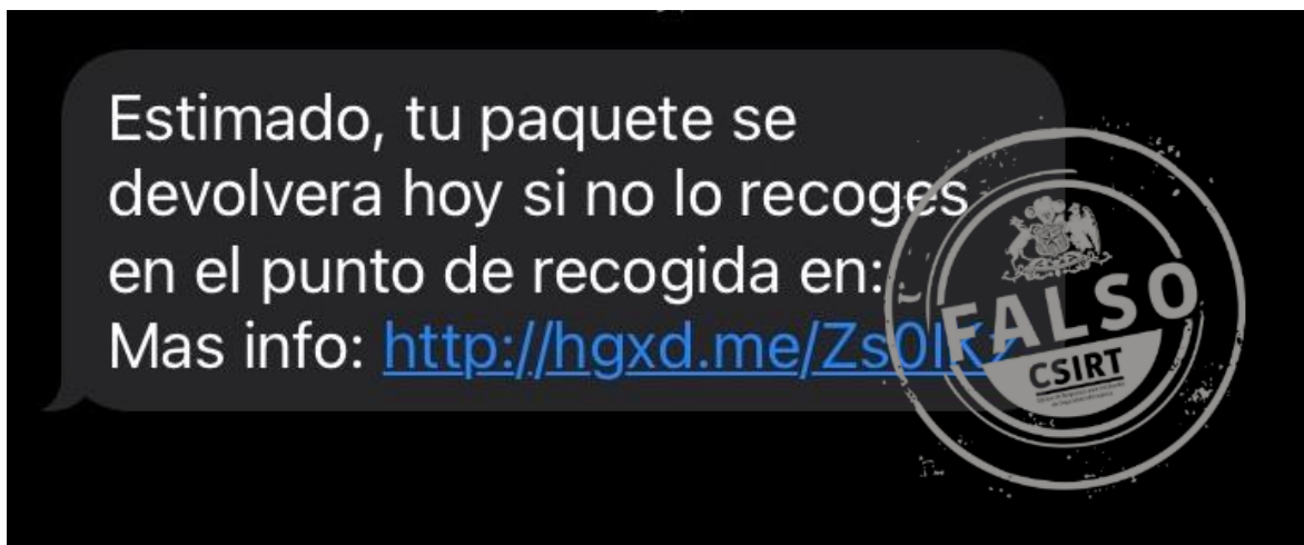
Imagen del mensaje

Equipo de Respuesta ante Incidentes de Seguridad Informática | CSIRT de Gobierno Ministerio del Interior y Seguridad Pública Subsecretaría del Interior