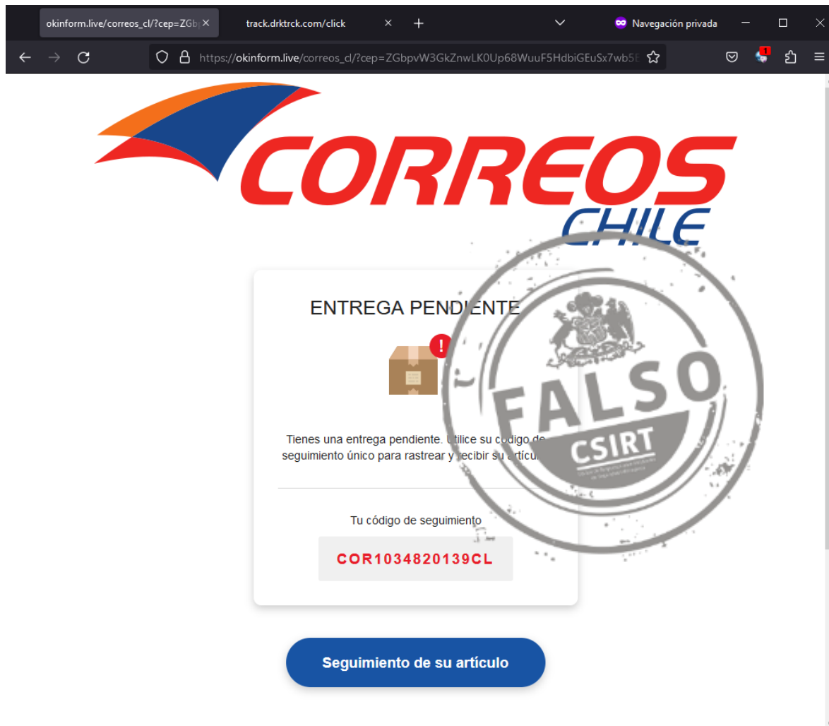
Imagen del sitio

Equipo de Respuesta ante Incidentes de Seguridad Informática | CSIRT de Gobierno Ministerio del Interior y Seguridad Pública Subsecretaría del Interior