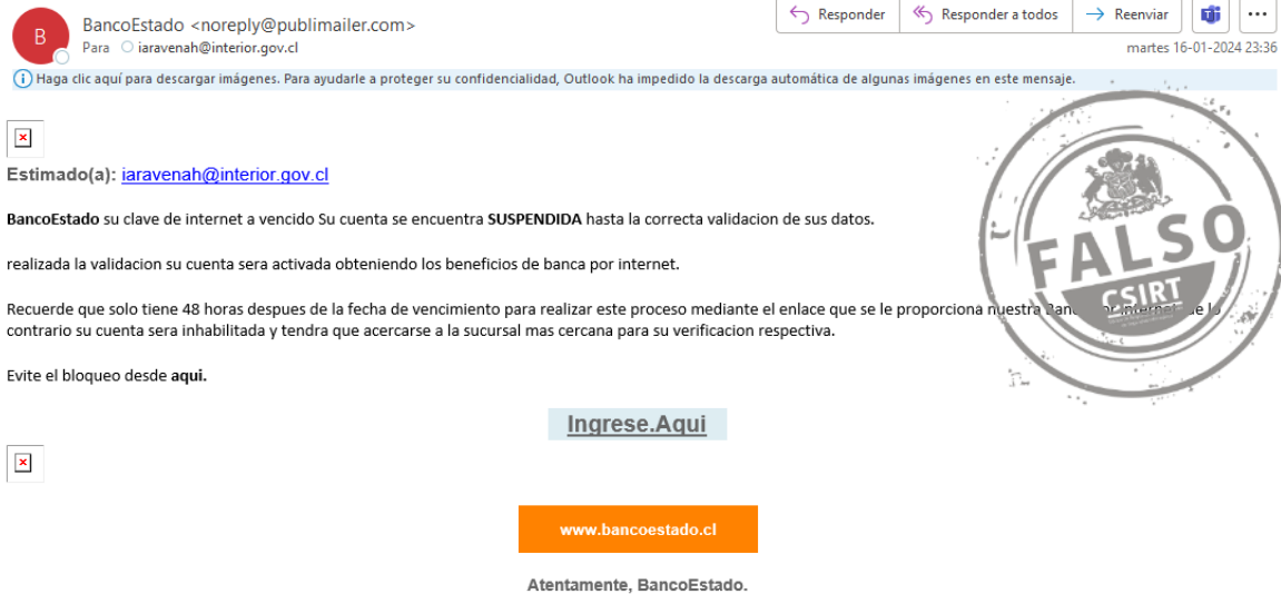
Imagen 1: Correo Electrónico