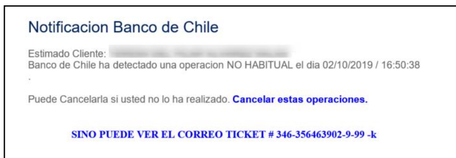
Imagen Sitio Web